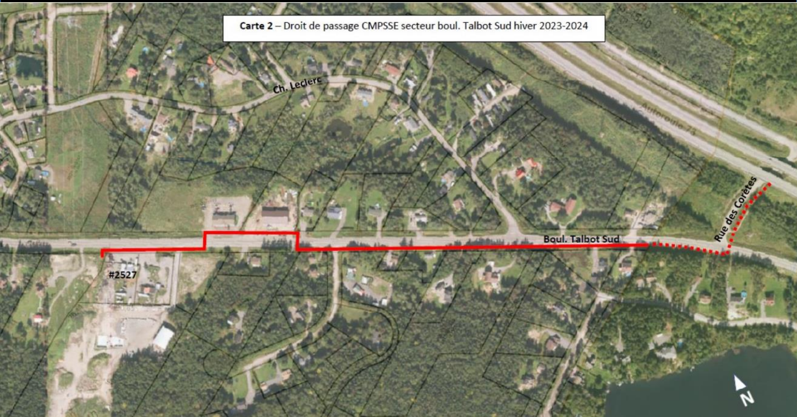
Carte 2 – Droit de passage CMPSSE secteur boul. Talbot Sud hiver 2023-2024